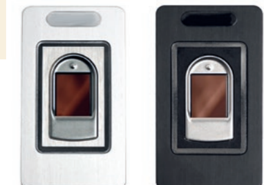
Das intelligente Zutrittsystem

Der in das Schließsystem integrierte Türwächter öffnet die Haustür zunächst nur einen Spalt breit. Erst eine Entriegelung erlaubt freien Zutritt. Die verdeckten Schlossteile werden beim Aufschließen von außen und mit einem Knäufel von innen ver- oder entriegelt.