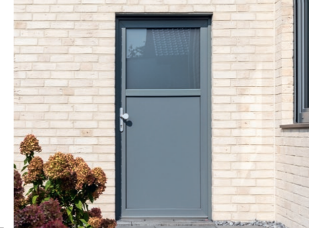
Auch der Zugang durch Keller- und Nebeneingangstüren ist bei Einbrechern sehr beliebt. Die Kripo empfiehlt dort geprüften und zertifizierten Einbruchschutz ab der Widerstandsklasse RC 2.

Haustüren bergen für Einbrecher ein hohes Entdeckungsrisiko. Trotzdem wählen Ganoven oft diesen Zugang, da viele Außentüren allein mit körperlicher Gewalt, ohne den Einsatz von Werkzeug, schnell zu überwinden sind. Geprüfte und zertifizierte einbruchhemmende Haustüren ab der Widerstandsklasse RC 2 bieten hingegen guten Schutz.