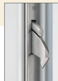
Das automatisch verriegelnde Schloss

Die robusten Stahlschwenkriegel senken sich aus dem Türflügel in die Schließbleiste am Blendrahmen und verzahnen beide derart stabil, dass einem Aufhebelversuch erfolgreich Widerstand geleistet wird.